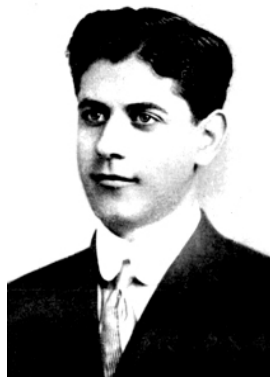
El joven Capablanca.

Los primeros años del Siglo XX encontraron un prodigio del Ajedrez, cuando en 1909 un desconocido joven cubano venció en un match al Gran Maestro Frank J. Marshall, campeón de los Estados Unidos, ganador de múltiples Torneos Internacionales y retador de Lasker por el Campeonato Mundial en 1907. La victoria de José Raúl Capablanca se produjo por amplio margen de 8 victorias por 1 y 14 empates.