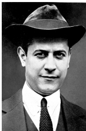
Capablanca como ex campeón