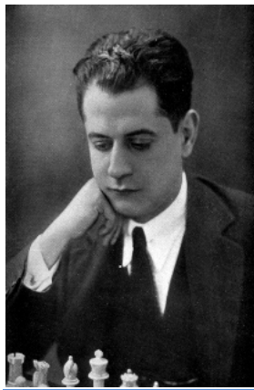
El nuevo Campeón Mundial

Capablanca vuelve a América y sigue sumando triunfos. Al final de la contienda bélica, viaja a Europa donde gana el Torneo de Hastings, 1919 llamado √El Torneo de la Victoria√, dedicado al triunfo aliado en la Guerra, con 10,5 puntos en 11 partidas. Sus éxitos arrolladores y su fama de imbatible le proporcionan la oportunidad de reunir la suma necesaria para enfrentar al Dr. Lasker en un match que se celebra en 1921 en La Habana. Capablanca vence limpiamente a Lasker 4 victorias sin derrotas y 10 empates. El alemán rehusó continuar el match, que establecía como ganador al primero que llegara a seis victorias. Ha sido el único match por el Campeonato Mundial donde el retador haya quedado invicto.